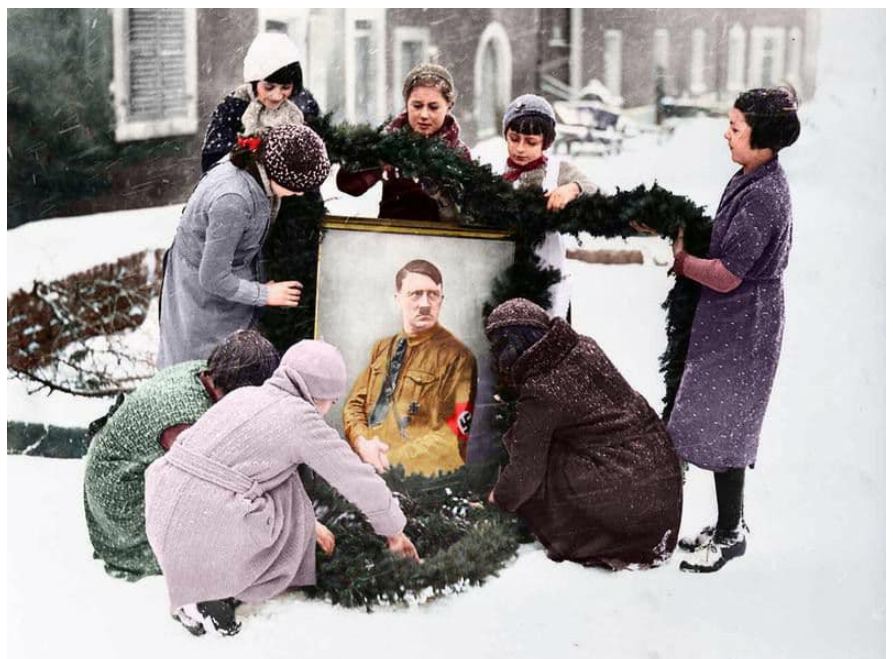
1935, Kinder schmücken ein Bild von Hitler

Ein Beispiel für die Nächstenliebe, um die er uns bat, war, dass sich 1938 eine Frau an mich wandte und sagte, ihr Mann sei Mitglied der KPD und 1934 ins Gefängnis gekommen, weil er zum Aufstand gegen den Führer aufgerufen und