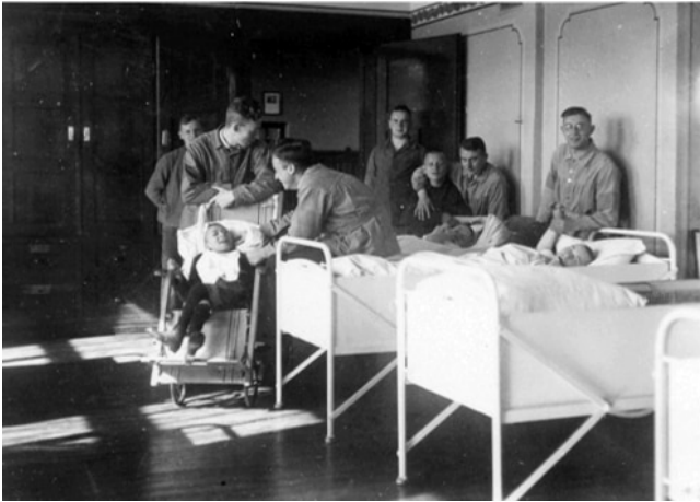
Station 13 im Werner-Haus

unterstützen. Wenn sie sich weigerten oder wenn keine Familie gefunden werden konnte, übernahm der Staat die Aufgabe. In Deutschland gab es viele Heime, in denen psychisch Kranke betreut wurden und sie verfügten über eine der besten Betreuungseinrichtungen der Welt. Es gab kein Ziel, diese unglücklichen Opfer von fehlerhafter, unkontrollierter Zucht oder schlechter Genetik zu töten.