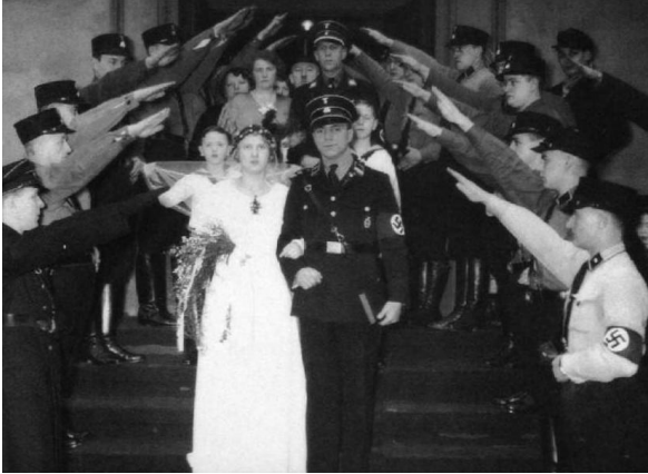
Kirchliche Trauung eines SS-Mannes in Uniform (1935)

vorstellen, dass Entartung und Faulheit ein Grund dafür sind, dass Ihre Nation in Schwierigkeiten kommt. Es ist kein Geheimnis, dass der Niedergang begonnen hat, wenn weiße, christliche Nationen Ausländer ins Land lassen. Ich möchte Sie mit den weisen Worten zurücklassen, die der Führer einmal bei einem Treffen zu uns sagte: "Ein Volk mit Lebenswillen, das seine Vorfahren liebt und seine Vergangenheit ehrt, indem es seine Zukunft schützt." Wenn unsere Nationen dies nicht beherzigen, wer weiß, was dann passieren wird.