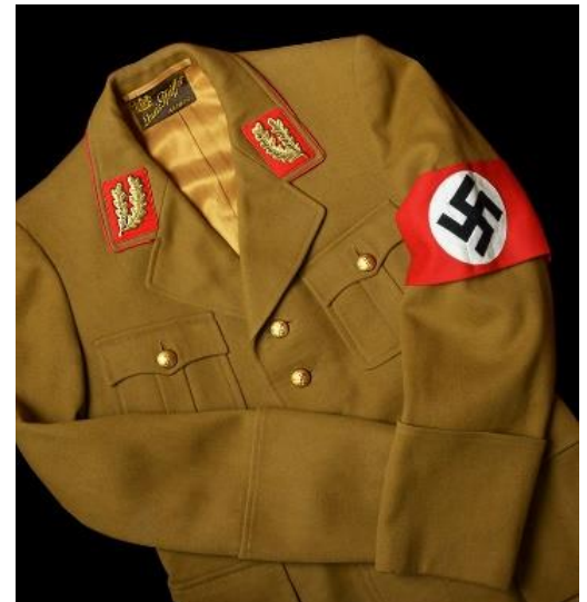
Insignien vor 1939

In unserer Partei gab es viele Machtkämpfe, weil viele Leute meinten, sie müssten das Amt des Parteichefs übernehmen, aber wir sind mit diesen Leuten schnell auf eine positive Art und Weise umgegangen, die ihnen einen Weg zur Führung eröffnete, ohne sich gegenseitig zu übergehen. Wir schufen Führungsschulen, um denjenigen, die die Führung übernehmen wollten, die Grundlagen unserer Politik zu vermitteln, damit sie ihrem Volk besser dienen konnten. Wir alle nahmen daran teil, um die Konzepte von Blut und Boden zu lernen und zu verstehen, mit gutem Beispiel voranzugehen, bei der Beurteilung von Staatsangelegenheiten fair zu sein und mit ehemaligen Feinden umzugehen. Es war ein stolzer Moment, als ich meine karmesinroten Führungsfarben erhielt, die meinen Status als Gauleiter symbolisieren.