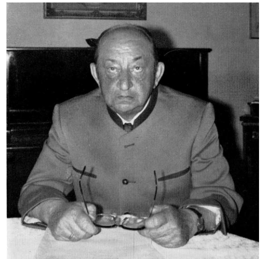
Nach Abschluss der Niederschrift von „Erlebt und erlitten“

Rudolf: Oh Mann, wo soll ich nur anfangen, die Juden sind wahrscheinlich das größte Missverständnis und die größte Lüge, aber die, die mich am meisten stört, ist die Lüge, dass wir unsere jungen Frauen gezwungen haben, Kinder für den Führer zu gebären. Ich finde, diese Lüge hat die Moral, für die wir gekämpft haben, eher beleidigt und verhöhnt. Time Life hat kürzlich eine Serie über den Zweiten Weltkrieg veröffentlicht, in der behauptet wird, dass während einer Parteiversammlung 10.000 deutsche Mädchen schwanger wurden. Völliger Blödsinn. Sie wollen den Leser glauben machen, dass eine große Sexparty unter der Tribüne stattfand und dass unsere Moral ein Witz war.