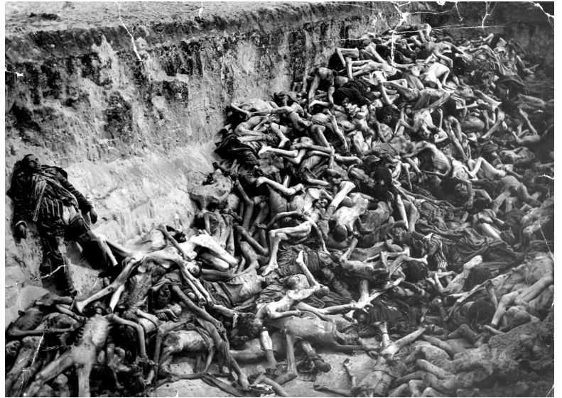
Massengrab im KL Bergen-Belsen mit Fleckfieberopfern, ausgehoben und gefüllt unter Leitung britischer Truppen nach Besetzung des Lagers im Frühjahr 1945.

Für all die Fotos und Filme, die Sie heute sehen, auf denen Reihen von Toten, sehr kranke und abgemagerte Menschen, die Öfen und die Hinrichtungen zu sehen sind, gibt es Erklärungen, die die Alliierten ignoriert oder vertuscht haben. Traurigerweise haben die Alliierten am Ende des Krieges viele der Todesfälle in Belsen und anderen kranken Gefangenenlagern verursacht. Durch die vorsätzliche Zerstörung aller unserer Städte haben sie genau das zerstört, was die Gefangenen brauchten, um gesund und satt zu bleiben. In den letzten beiden Kriegsmonaten herrschte in Deutschland ein derartiges Chaos, dass in einigen Lagern der Typhus außer Kontrolle geriet. Sogar in Dachau wurde ein Zug mit Häftlingen aus dem Lager Belsen von alliierten Flugzeugen angegriffen, wobei viele kranke Häftlinge starben, die nicht mehr ausgeladen und begraben werden konnten, bevor die Alliierten sie fanden. Dann töteten die Alliierten unschuldige Soldaten, die zufällig in der Nähe des Lagers waren. Das ist es, worauf ich hinweisen möchte.