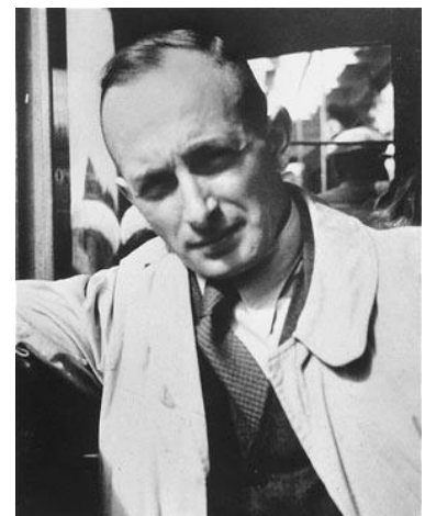
Adolf Eichmann, Portraitfoto, 1942

Es gab Anschläge auf NSDAP-Mitglieder, Politiker wurden ermordet, Brände gelegt und Juden arbeiteten offen daran, den Führer zu diskreditieren und zu demütigen. Deshalb wurden sie, wenn sie erwischt wurden, in Lager geschickt, wenn sie es sich nicht leisten konnten, in ein anderes Land zu gehen. Viele Länder weigerten sich, noch mehr Juden aufzunehmen, weil sie genau wussten, was das bedeutete. Daher mussten wir ab 1933, als wir die Macht erlangten, Elemente bekämpfen, die darauf aus waren, das zu zerstören, was wir so hart aufgebaut hatten. Jeden, der Verbrechen gegen uns beging, schickten wir in Lager, um ihn aus der